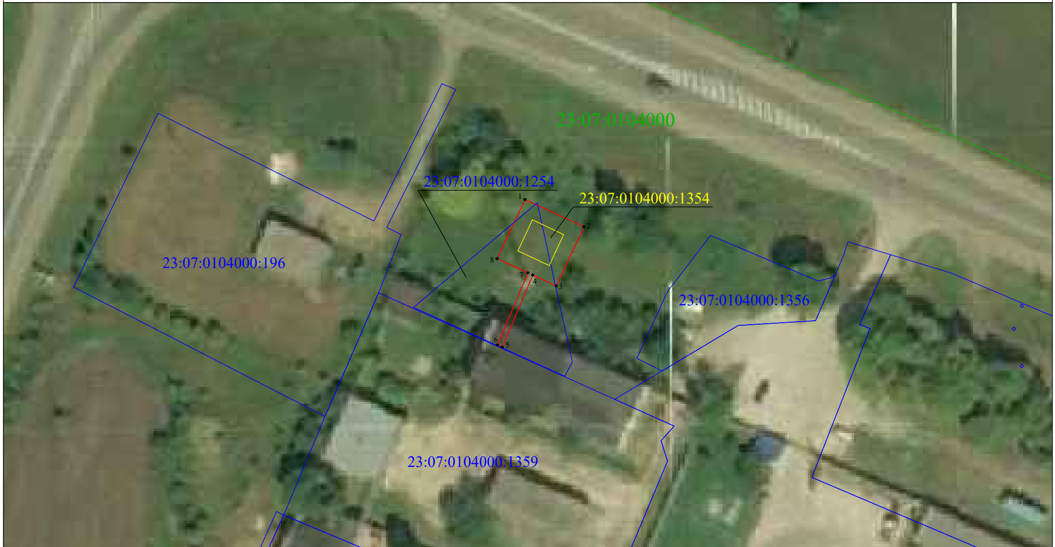
Схема границ публичного сервитута

Используемые условные знаки и обозначения: